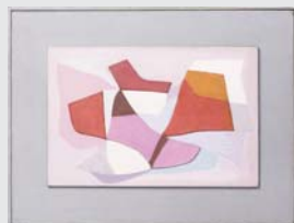
Henryk Stażewski, str. 64