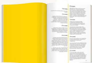
Cała strona 210 x 250 mm 1000 PLN