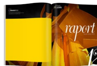
Okładka tył 210 x 167 mm 1500 PLN