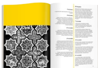
1/3 strony 210 x 83 mm 550 PLN