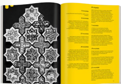
Artykuł 5 - 7 tys. znaków (jedna strona) 2000 PLN