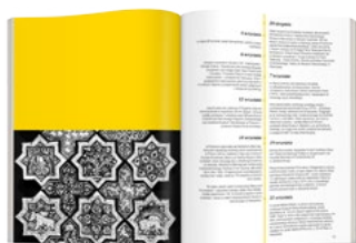
1/2 strony 210 x 125 mm 700 PLN