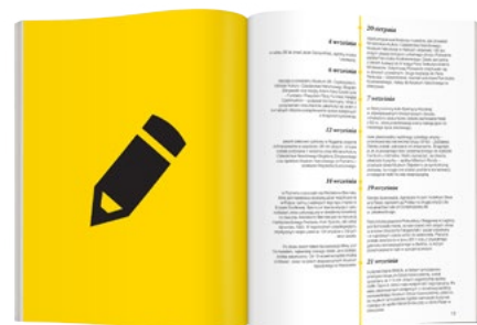
Obsługa graficzna Przygotowanie reklamy graficznej 400 PLN

TERMIN PRZYJMOWANIA MATERIAŁÓW: 15 GRUDNIA 2013